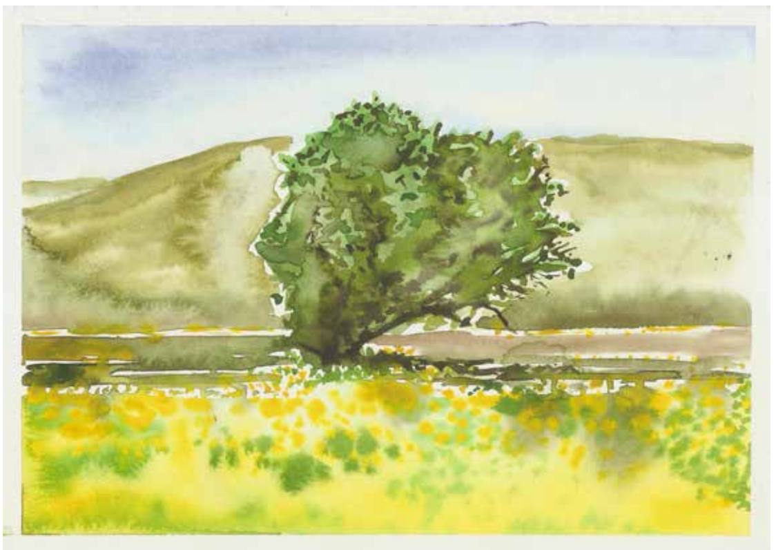
Δέντρο στο κάμπο 18,50x13cm, ακουαρέλλα σε χαρτί

«Κοιτάζοντας τον κάμπο με παρέσυρε η παρόρμηση να πάω εκεί κάτω να ζωγραφίσω μέσα στα λουλούδια. Έντονες εικόνες και ονειρικές. Πέρα από τις φωτεινές με χρώματα εικόνες ακουγόντουσαν παντού ήχοι από έντομα και πουλιά. Ένοιωθα μοναδικός μέσα σε αυτή την ποικιλομορφία της φύσης. Γίγαντας για τα λουλούδια και τα έντομα. Το μόνο που μου έμοιαζε ήταν μερικά δέντρα που τα είχαν αφήσει στα χωράφια. Μου έκαναν εντύπωση από το έντονό τους χρώμα αλλά και από την σκιά που δημιουργούσαν πάνω στο κίτρινο χαλί των λουλουδιών.»