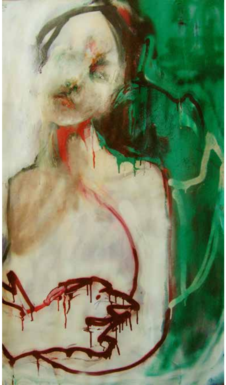
Αδέλμα μικτή τεχνική σε μουσαμά, 60x120cm